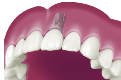
Implantaat voorzien van een kroon