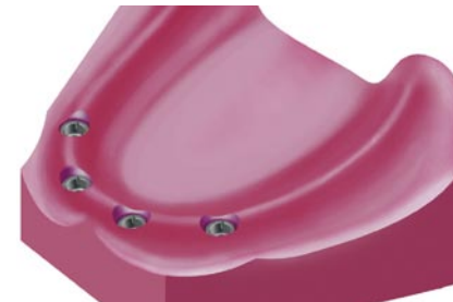
Vier implantaten in de onderkaak.