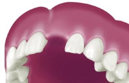
Situatie na verlies van een tand