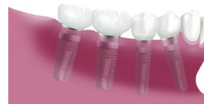
Vier implantaten elk voorzien van een kroon