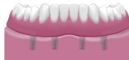
Vier implantaten voorzien van een uitneembare prothese.