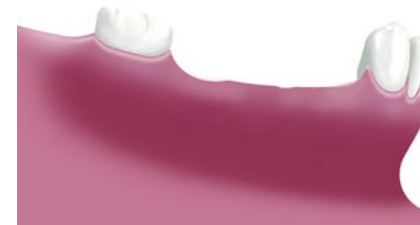
Situatie na verlies van meerdere kiezen

Met implantaten is het mogelijk weer een vaste voorziening terug te krijgen. Er worden dan op de plaatsen van de ontbrekende gebitselementen implantaten geplaatst met daarop enkelvoudige kronen of een brug.