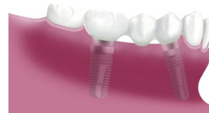
Twee implantaten voorzien van een brug